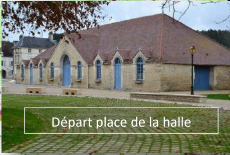
Départ place de la halle