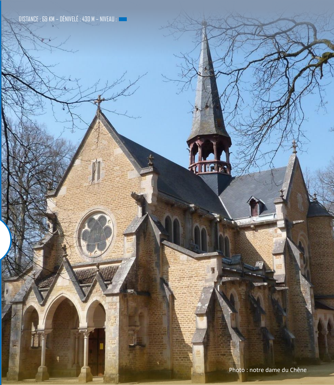
Photo : notre dame du Chêne