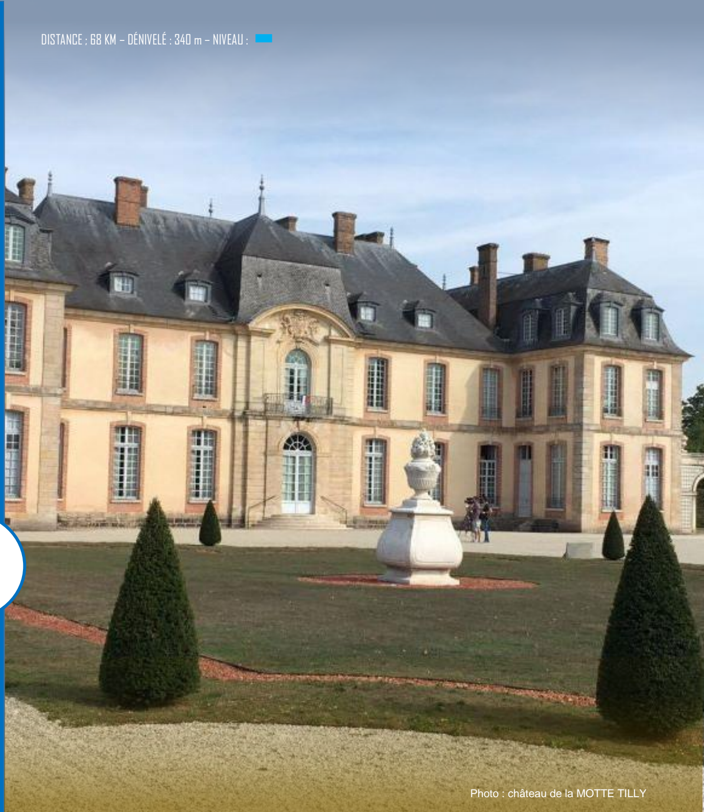
Photo : château de la MOTTE TILLY